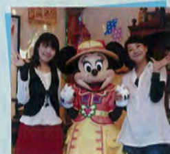
ミッキー&フレンズ・グリーティングトレイル(イメージ)

★撮影時期や撮影場所によって、キャラクターの写真やフレームが変更となります。また、台紙はお写真1枚のもの(キャラクター達の写真がないもの)になる場合があります。