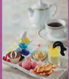
ディズニーアンパサダーホテルメニュー(イメージ)