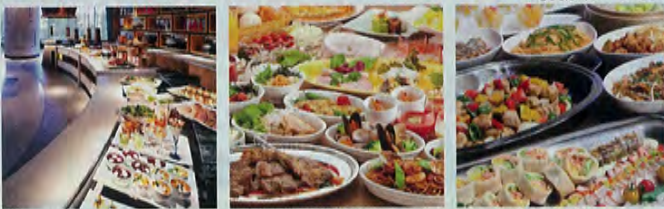
ヒルトン東京ベイ [ナイスナックbuffet]