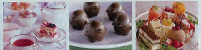
ホテルオークラ東京ベイ [ケーキセット]