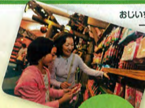
おじいちゃん、おばあちゃんと 一緒に思い出作り!

子どもたちが笑うと、おばあちゃんも笑顔になる。大好きなおじい ちゃん、一日中いっしょにいられる。家族のしあわせな時間が、かけが えのない夢の時間に。さあ、世代をこえて、家族みんなで東京ディズ ニーリゾートへ。ここは、すべてのゲストの、夢がかなう場所だから。