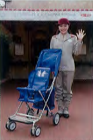
ベビーカー&車イス・レンタル(イメージ)

東京ディズニーランド・東京ディズニーシーの「ベビーカー&車イス・レンタル」にて貸し出しているベビーカーを予約することができます。