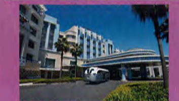
ディズニーアンパサダーホテル外観