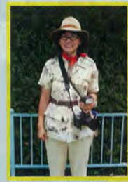
カメラマンキャスト(イメージ)

★撮影時期や撮影場所によって、キャラクターの写真やフレームが変更となります。また、台紙はお写真1枚のもの(キャラクター達の写真がないもの)になる場合があります。