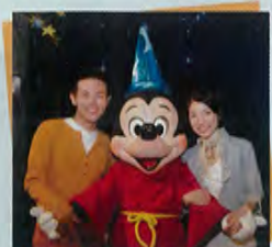
ミッキーの家とミート・ミッキー(イメージ)