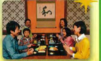
パーク内の和食レストランでお食事を。